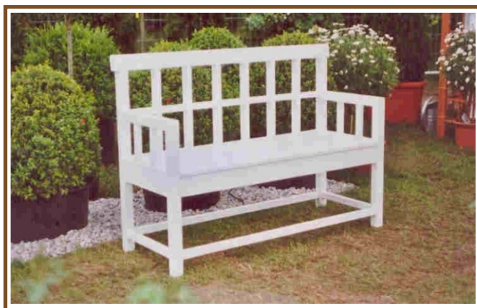
L 1,93m Grunewald-Bank No. B 61