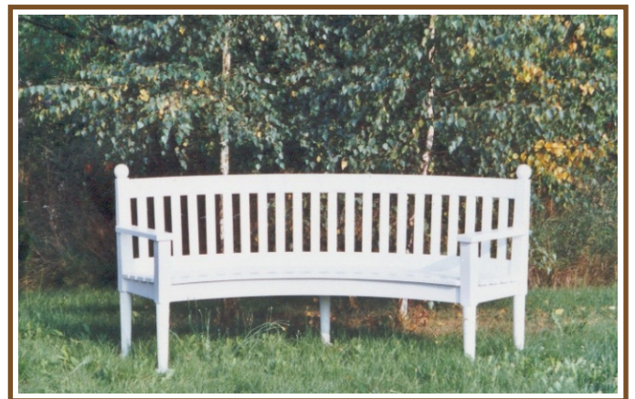
L 2,30m Lembeck Rundbank No. RB 60