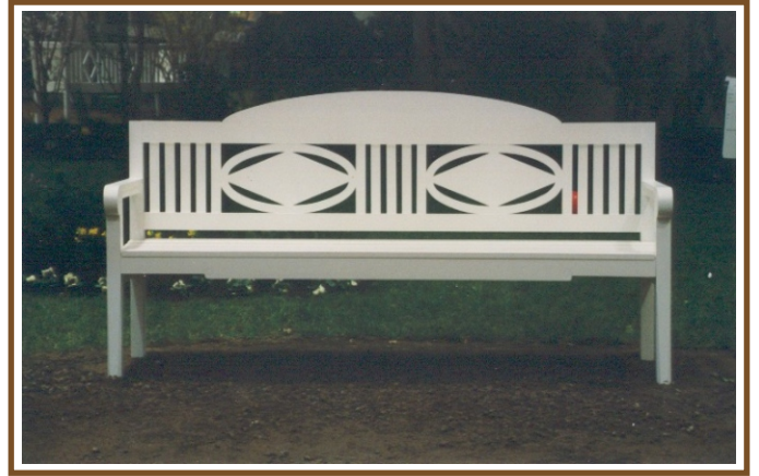
L 2,15m Behrens-Bank No. 58