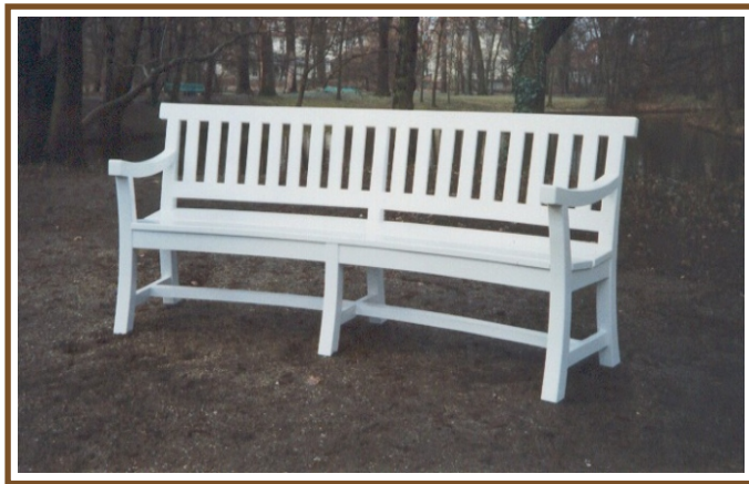
L 2,30m Charlottenburg Rundbank No. RB 59