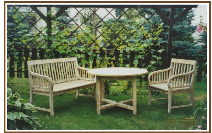
Bank L 1,30 Tisch Ø 0,90m Sessel Br 0,65m Ribeck No. B 62 No. T 62 No. S 62