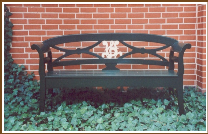
L 1,92m Sylt mit Violinschlüssel No. 55V