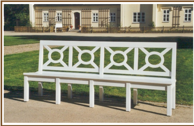
L 2,46m Weimar No. 57