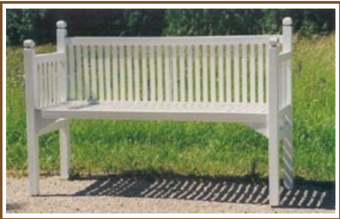
L 1,37m Klinger-Bank No. 34