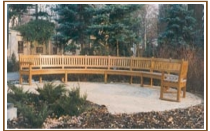
Außen-Ø 6m (5-teilig) Mosigkau Rundbank No. RB 33