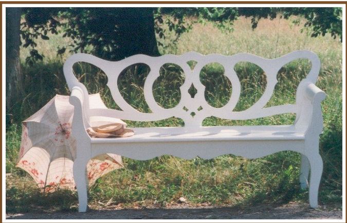
L 1,75m Ostramonda No. 35