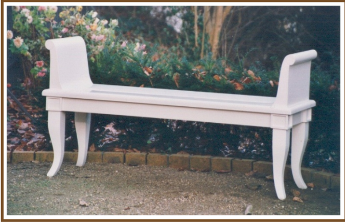
L 1,40m Goethe-Bank No. 30