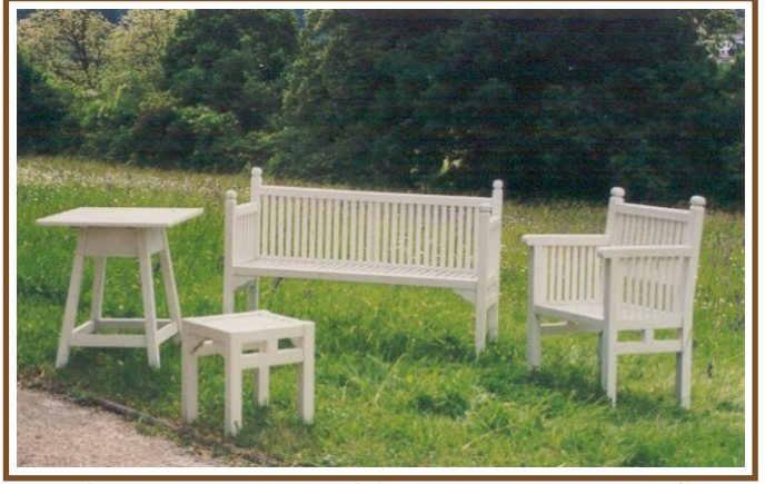
Bank-Länge 1,37m Klinger-Sitzgruppe No. 34 Tisch 0,65 x 0,62 m No. T34 Beistelltisch 0,40 x 0,40 m No. T34