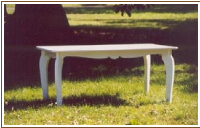
Carwe (Tisch) No. T32